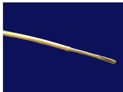
Obr. 3 - odizolované lanko